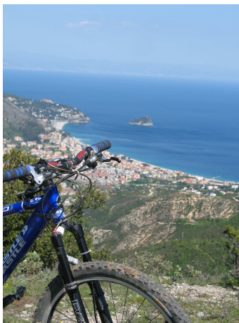
Bric dei Monti

Partendo da Spotorno affrontiamo questo percorso che misura circa 30 Km , toccherà i punti più caratteristici del Golfo di Spotorno, dal Monte Mao a Capo Noli, passando da Bric dei Monti con la magnifica vista dell'Isola Gallinara e l'isola di Berteggi.