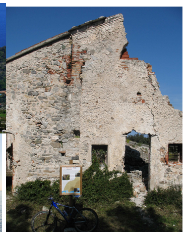
Chiesa di S. Margherita